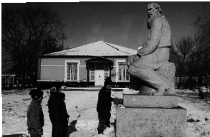
Памятник и дом-музей Л.Н. Толстому в Толстой-Юрте

публики ежедневно получало около 1 млн экземпляров периодических изданий 19 . В республике было несколько профессиональных союзов (писателей, художников, композиторов журналистов и другие).