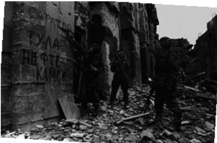
“Федералы” у стен чеченского “рейхстага”

“противник” или “враг“ вовлеченные в конфликт стороны подразумевают смутные категории. Для чеченцев это были “федералы”, “русские”, “оккупанты”, “агрессоры”, “неверные”, “гяуры”. Для федеральных российских солдат в Чечне – “бандиты”, “духи”, “нохчи”, “душманы”, “чечены”, “боевики”, “террористы”, но с самого начала и всегда это были “не наши”, хотя речь шла о согражданах (как выразился один из чеченцев, “я бы мог служить и воевать с этими ребятами в одной армии” ).