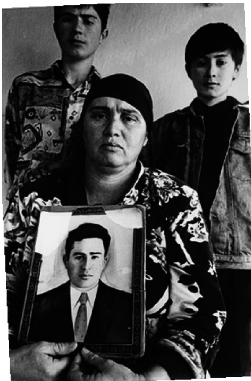
Чеченка с фотографией покойного мужа и с детьми