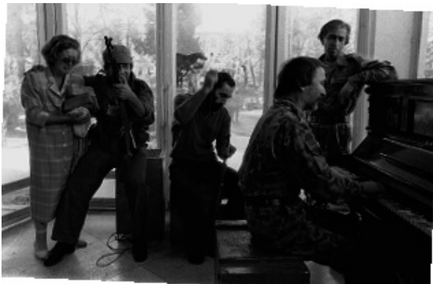
Музыкальный ансамбль боевиков