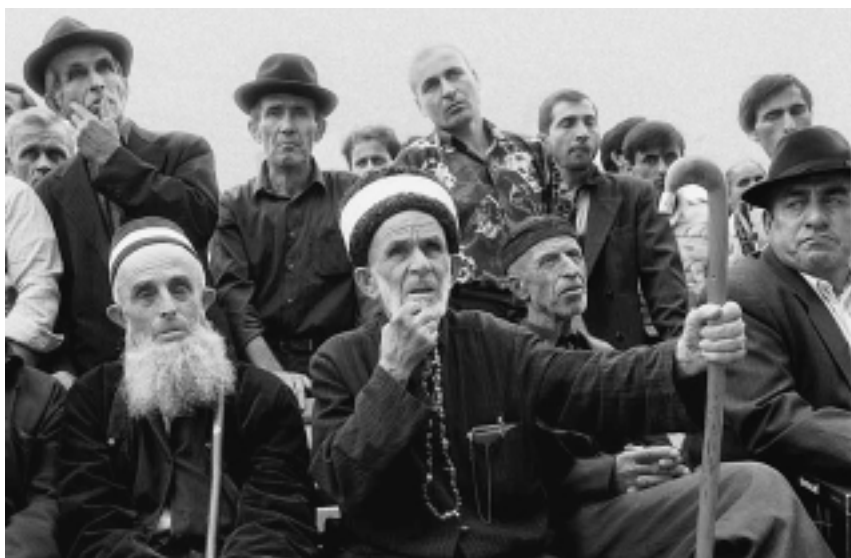
Чеченские мужчины на собрании