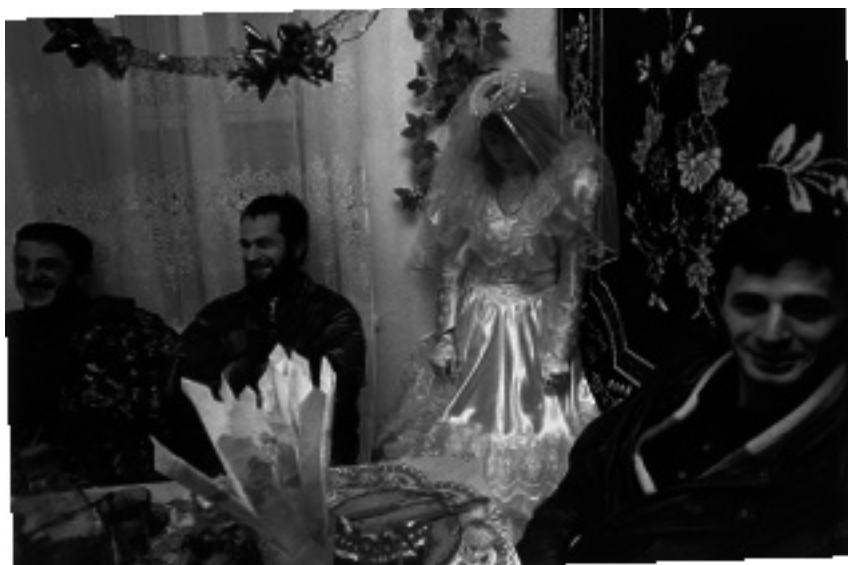
Чеченская свадьба в годы войны