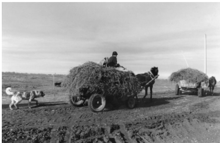
Заготовка сена в равнинной Чечне. Ноябрь 1999 г.