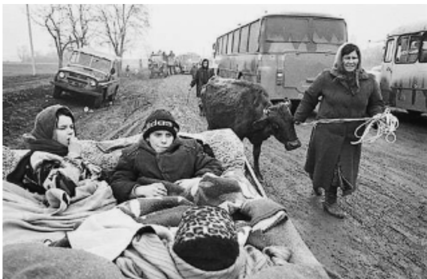
Бегство жителей из Грозного