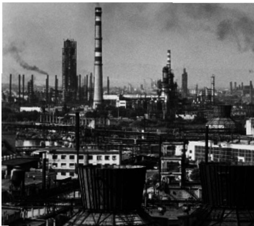
Грозненский нефтехимический комплекс. 1985 г.

разование. Д. Гакаев отмечает еще один важный аспект социальной ситуации: