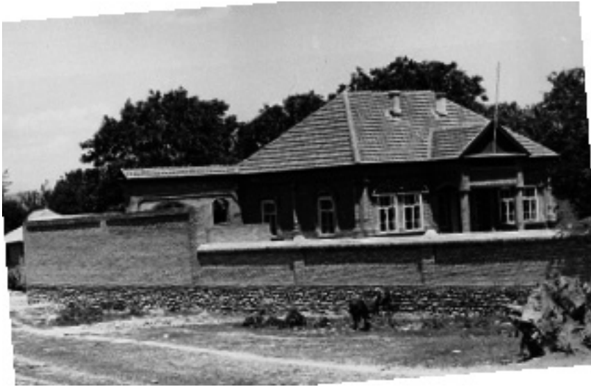
Чечня, дом колхозника в с. Маиртуп. 1969 г.