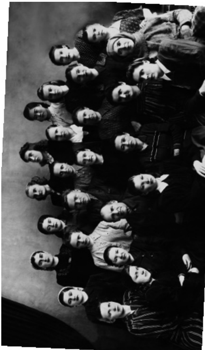
Коллектив швейной фабрики в Павлодаре. 1951 г.