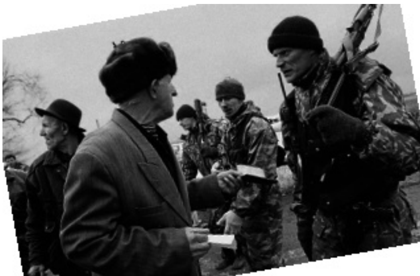
Блокпост “Кавказ”

мориал” 11 . Имеются достоверные свидетельства о том, что основные жертвы воюющие и мирные граждане понесли в начальный период войны. Хорошо известны многочисленные случаи, когда в условиях жестоких боев в Грозном и в других местах убитых и даже раненых не вывозили. Тема брошенных трупов – стала одной из главных в военных историях. Она обросла чудовищными слухами, в которые люди верили и рассказывали друг другу уже после войны.