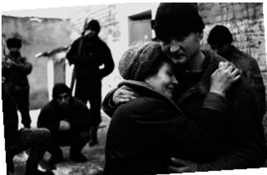
Освобождение заложника

тастазы потянулись в Поволжье, на Урал и в Москву. И практически во всех сводках, информационных сообщениях, показаниях фигурировала Чечня как организатор, исполнитель или соучастник этого опасного и разного вида преступления. К этому времени Чеченская республика не только выпала из-под юрисдикции российских законов и оказалась вне зоны действия российских спецслужб. Чечня под дулами автоматов неуклонно катилась в дикое и кровавое средневековье. Сейчас вряд ли кто сможет сказать, сколько сотен самих чеченцев были унижены похищением родственников и уплатой выкупа за них, но факты свидетельствуют, что в первую очередь от кавказского киднэпинга пострадал чеченский народ. Сказать, что власти неадекватно отреагировали на похищения, а практически на организованную работорговлю значит выразиться предельно мягко и деликатно. Ситуация развивалась весьма скверно” 1 .