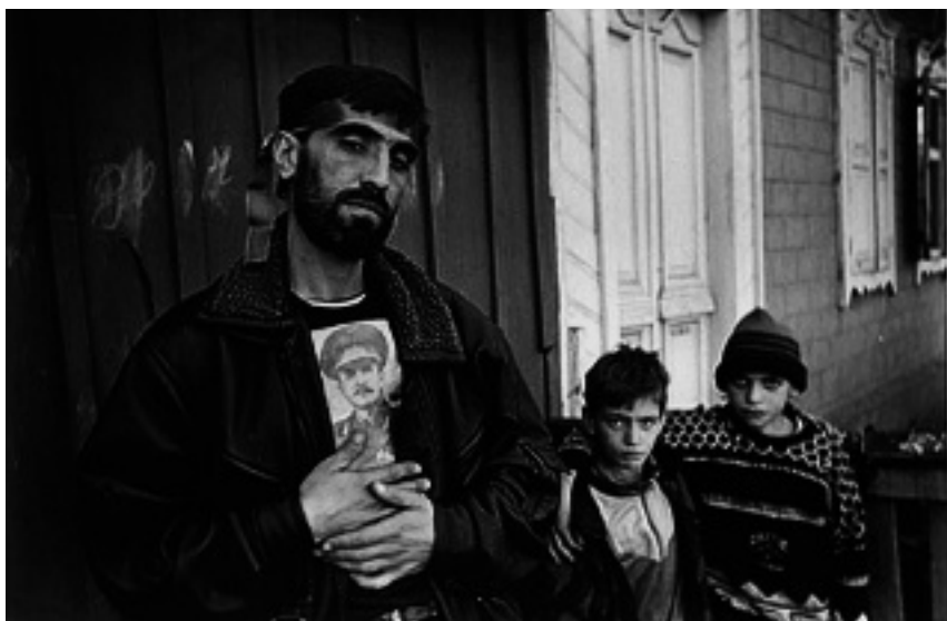
Молодые чеченцы с портретом Джохара Дудаева

“Дудаев для меня был хорош тем, что он, когда в ящик (речь идет о телевизоре. – В.Т.) скажет два слова, сразу ясно, что надо делать. А у других мало что поймешь. Если он вернется, тогда весь Кавказ будет его” (Ахьяд).