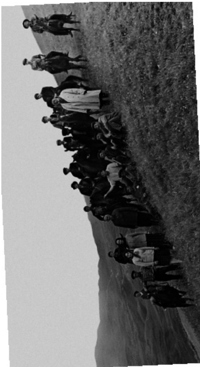
Чечня, группа живогноводов с. Игум-Кале на пастбище. 1970 г.