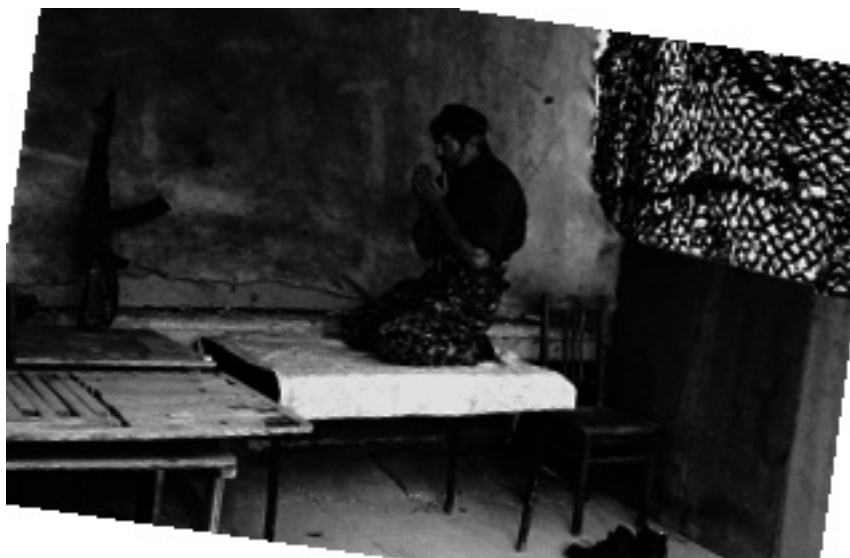
Намаз с “Калашниковым”

ствольника. Когда польхнуло в окне, ребята, видимо, не поняли, что грохнули его, иначе они раньше меня бросились бы за трофеем, у снайперов-то оружие дорогое. А я понял раньше, что ребята его достали и с другой стороны дома сквозанул в проем. Ребята еще гроыхали, а я первым подбежал к снайперу, кажется, он был еще живой. Да при нем же деньги были. И схватил, что мне причитается, и опять ринулся в свой проем. Те ребята, должно быть, потом удивлялись, не найдя оружия. Ан не зевай! Сами виноваты. Такой порядок, пусть сами на себя обижаются» (Халид).