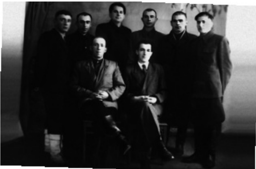
Комсомольский актив Назрановского района Чечено-Ингушетии. 1959 г.

в Казахстане и Киргизии 524 тыс. человек (418 тыс. чеченцев и 106 тыс. ингушей) в Чечено-Ингушетию прибыло 432 тыс. (356 тыс. чеченцев и 76 тыс. ингушей), в Дагестан – 28 тыс. (в основном чеченцы) и в Северную Осетию – 8 тыс. ингушей. Таким образом, общее население республики составило 892,4 тыс. человек, из них 432 тыс. – чеченцы и ингуши. В Казахстане остались проживать 34 тыс. чеченцев и 22 тыс. ингушей (в этой же справке приводится и другая цифра: на 15 октября 1960 г. на территории Казахстана – около 100 тыс. и на территории Киргизии 6 тыс. чеченцев и ингушей).