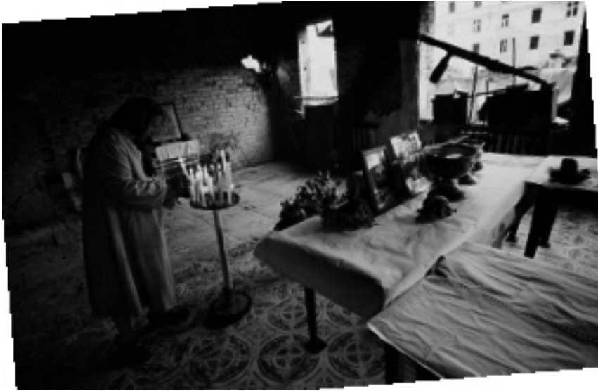
В разрушенной православной церкви Грозного

– Я считаю, что полученное нами образование хорошее. Но вот сегодня традиционному образованию, которое мы получили, навязывается альтернатива. Эта альтернатива связана с какими-то восточными образовательными и культурными ценностями, с арабо-мусульманскими ценностями. Что нам лучше? Все-таки я считаю, что чеченцы и вообще кавказцы – другая цивилизация, чем арабо-бедуинская или западная цивилизация.