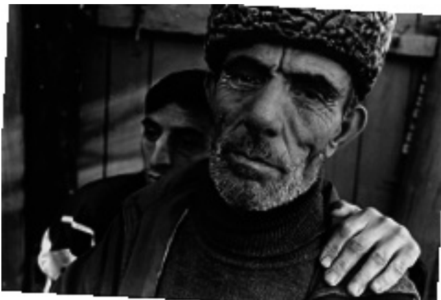
Отец и сын

каль. Сначала пошел средний, воевал. Приходил к нам, сюда домой, когда мы скрывались здесь в подвале. Младшего я поначалу не отпускал. Но, видно, он посмотрел на старшего брата и сам ушел. Когда уходил старший, я не противился. Знал, что люди попрекнут, что он отлынивал, когда всем миром воевали. А младшего не отпускал от себя. Все-таки опора мне – старику. Должно быть, чуял я недоброе. Погиб младший. Я, видишь, и на финской побывал, и в отечественной воевал. После последней войны, видишь, хромой сделался. Я долго в толк не мог взять, с кем теперь воюем. Вроде бы одна страна. Помню, когда на отечественную призывали, колонну нашу провели вот тут же по Первомайской. А теперь по этой же Первомайской двигались российские войска. Вроде бы мир перевернулся” (Вадуд).