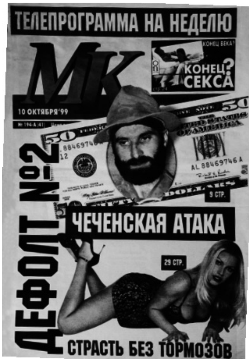
Первая страница газеты “Московский комсомолец”