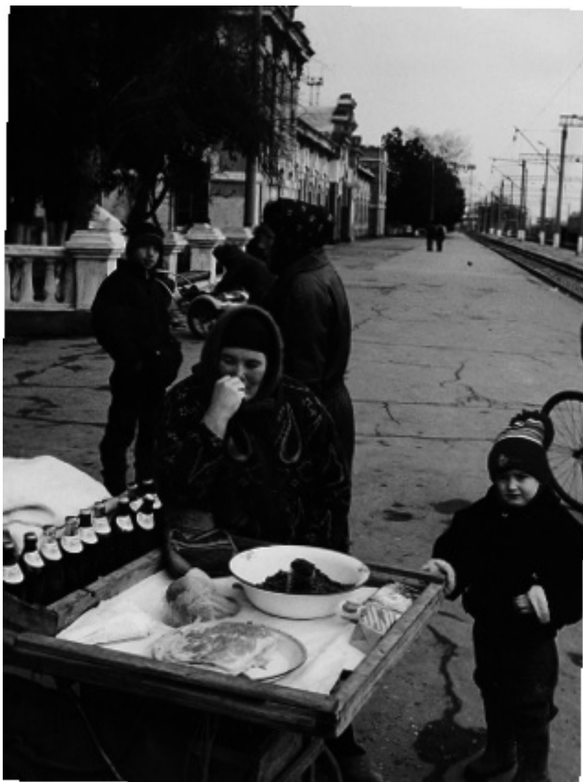
Торгующая женщина на вокзале в Гудермесе

имел 530 га посевов пшеницы и ячменя и получил средний урожай 21 ц. с га. Буквально “сидя на нефти”, сельские хозяйства испытывали недостаток горючего и смазочных материалов, а также сельскохозяйственных машин (тракторов, комбайнов). Крупного рогатого скота и овец в Чечне сохранилось столько, сколько в прошлом было в одном только крупном хозяйстве.