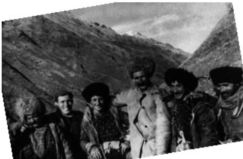
Чечня, жители с. Мелхисты. 1939 г.

территорию между реками Аксаем, Сунжей и Большим Кавказским хребтом, а ныне живущая смешанно с русскими и кумыками в Терской области, между Терекком и южной границей области”. Всех чеченцев, не считая ингушей, числилось на 1887 г. 195 тыс. Свое название они ведут от названия аула Большой Чечен, “служившего некогда центральным пунктом для всех собраний, на которых обсуждались военные планы против России” (?). О древнейших судьбах чеченского племени не имеется никаких данных, кроме фантастических легенд о чужеземцах (арабах), основателях этого народа. До 1840 г. отношение чеченцев к России было более или менее мирное, “но в этом году они изменили своему нейтралитету и, озлобленные требованием со стороны русских о выдаче оружия, перешли на сторону известного Шамиля, под предводительством которого в течение почти 20 лет вели отчаянную борьбу против России, стоившую последней огромных жертв. После войны часть чеченцев эмигрировала в Турцию, а часть переселилась с гор на плоскость”.