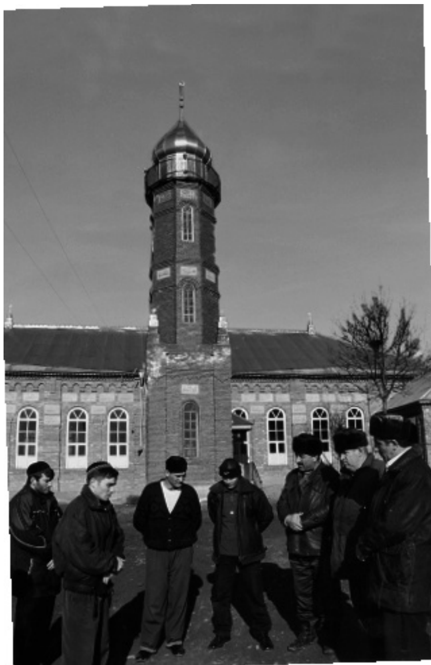
Сельская мечеть