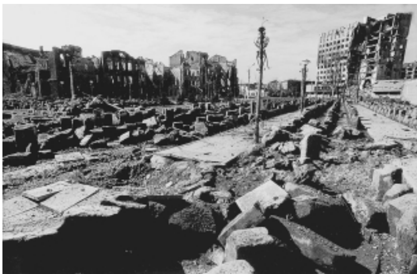
Руины центра Грозного