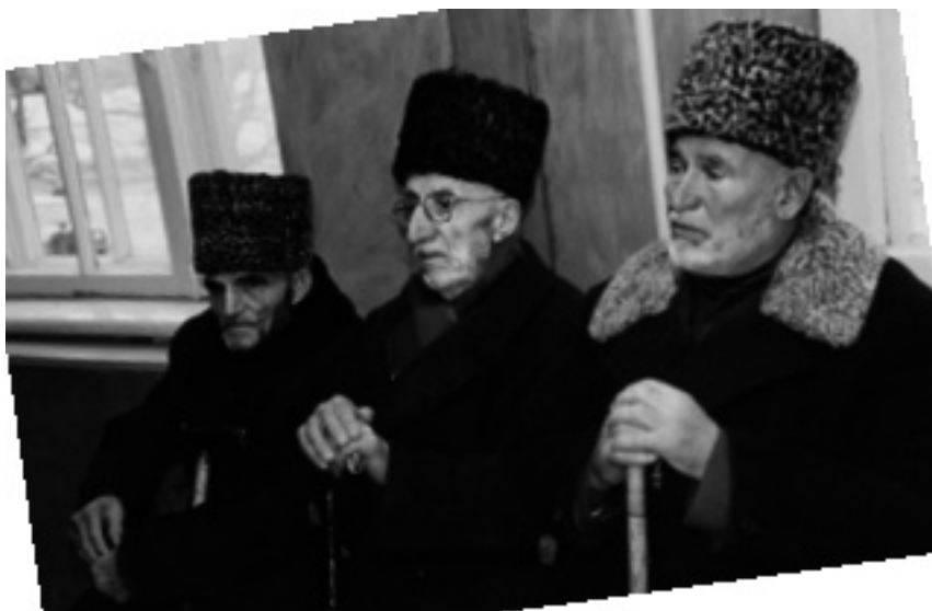
Старейшины с. Толстой-Юрт

сыграл учитель-мулла, который, показывая, прекратив занятия, поощрял действия детей, в том числе деньгами, которые выплачивались за участие в митинге.