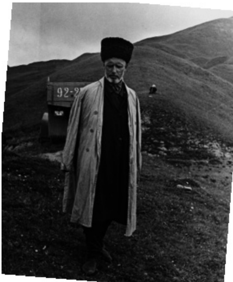
Чеченец с. Саярсана Ножай-Юртовского района. 1970 г.

вследствие их подозрительности, склонности к коварству и суровости, выработавшихся, вероятно, во время вековой борьбы (?). Неукротимость, храбрость, ловкость, выносливость, спокойствие в борьбе – черты чеченцев, давно признанные всеми, даже их врагами. В обыкновенное время идеал чеченцев – грабеж. Угнать скот, увести женщин и детей, хотя бы для этого пришлось ползти по земле десятки верст и при этом рисковать своей жизнью – любимое дело чеченца....Во время своей независимости (?) чеченцы, в противоположность черкесам, не знали феодального устройства и сословных разделений. В их самостоятельных общинах, управлявшихся народными собраниями (?), все были абсолютно равны (?). Мы все “уздени” (т.е. свободные, равные), говорят теперь чеченцы. У немногих только племен были ханы, наследственная власть которых ведет свое на-