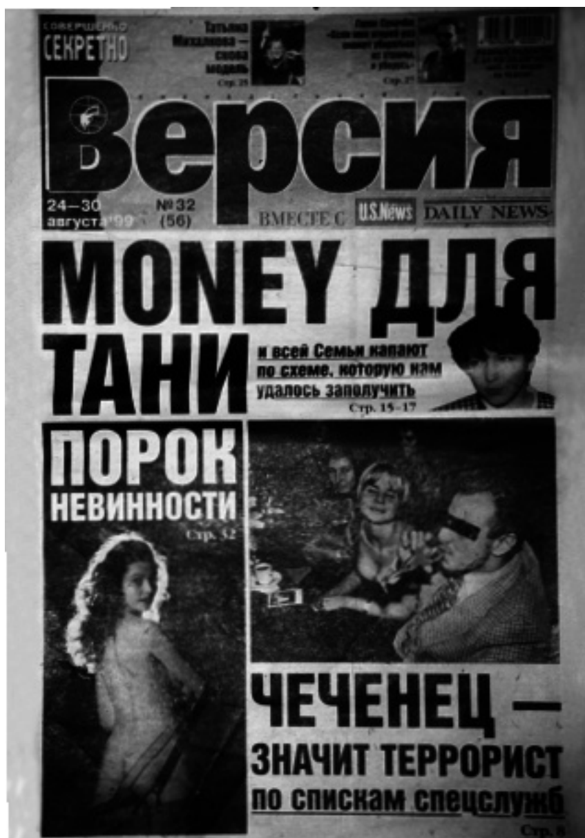
Первая страница газеты “Версия”