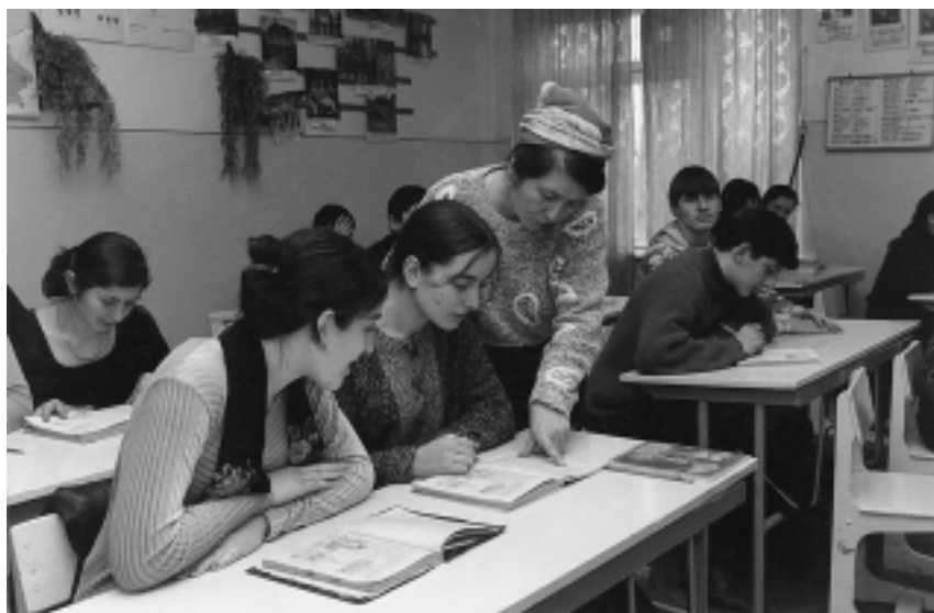
Занятия в старших классах средней школы г. Гудермеса. Декабрь 1999 г.