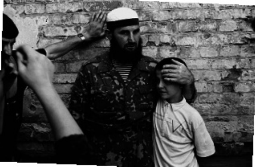
Чеченский боевик с ребенком

Но потом ему удалось выйти из этого состояния. В апреле он приехал в Махачкалу, навестил нас. Решил, что там нам безопаснее. Грозный был еще заминирован, там были федералы.