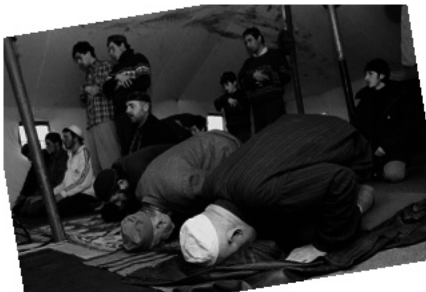
Чеченцы совершают намаз

ни и сторонились политики. До этого они действовали в местах проживания и ограничивались дежурными призывами о необходимости укрепления власти в республике. Деятели таррикатистского ислама вплоть до 1996 г. удавалось сдерживать религиозных экстремистов. Ваххабиты терпели поражение в идеологическом противостоянии с традиционным духовенством Чечни, и к 1996 г. о них почти забыли. Наоборот, тарикатный ислам заметно укрепился и стал на виду, хотя, кроме запрета на алкоголь, чеченское духовенство не стремилось радикально изменить светский образ жизни в республике. Его требования носили умеренный характер и были направлены на создание удобств желающим молиться в любом месте. В учреждениях и организациях стали открываться моленные комнаты. Однако по причине общей разрухи новые мечети фактически не строились.