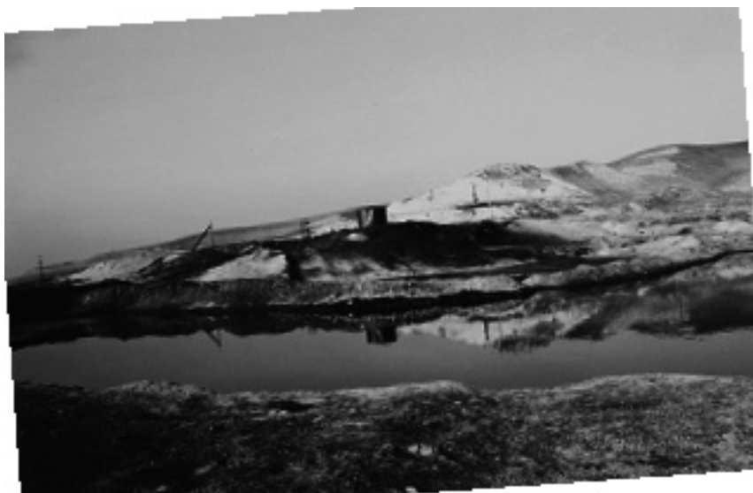
Подпольный нефтяной мини-завод

“По разбитым пыльным дорогам, не давая прохода пешеходам, движутся тысячи приватизированных, ворованных, без госномеров автомашин и большое количество нефтевозов. Столбы пыли вместе с выбрасываемым гаром горючего они оставляют для жителей этих сел, как мука из сита все это оседает на зданиях Курчалойской больницы, на деревьях и жилых постройках. Черные тучи над селами появляются из-за злосчастного нефтеварения. Если сами мы не осознаем, что оно наносит вред нашему здоровью, нашим детям, будем ожидать, пока порядок наведут властные органы, то глотать эту отраву придется долго. Нет секрета для местных жителей, кто и где занимается варкой нефти. Но нет примера, когда жители аулов вышли бы на дорогу и запретили проезд нефтевозов через их аулы и земли” 14 .