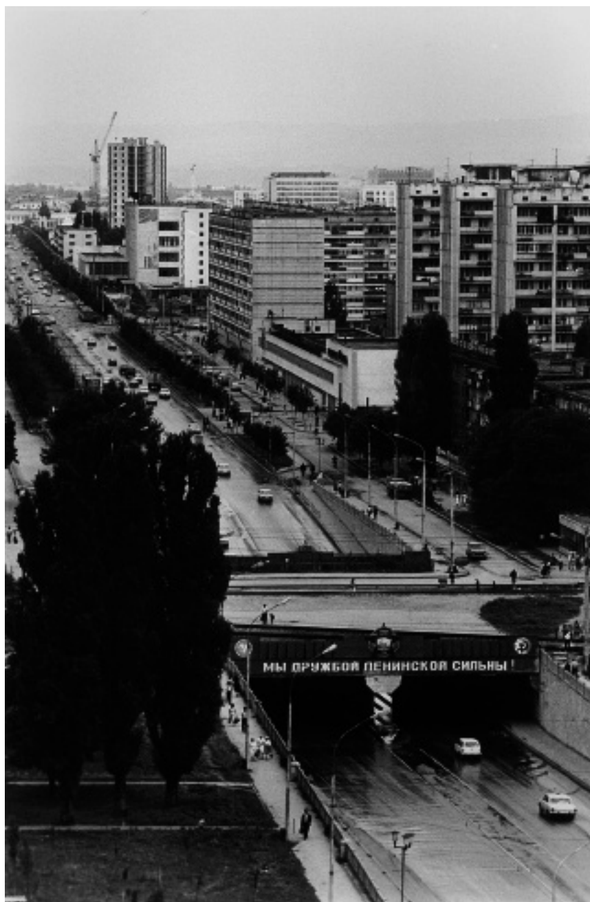
Город Грозный. 1985 г.