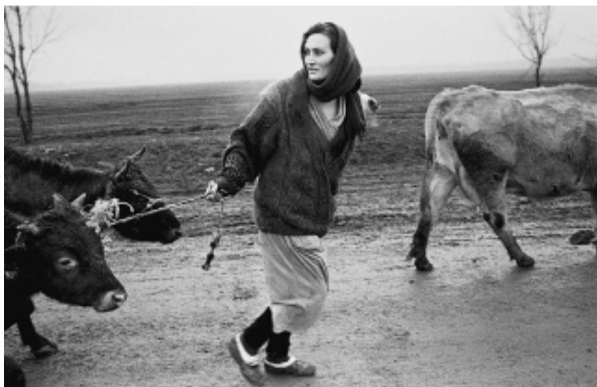
Женщина спасает домашний скот