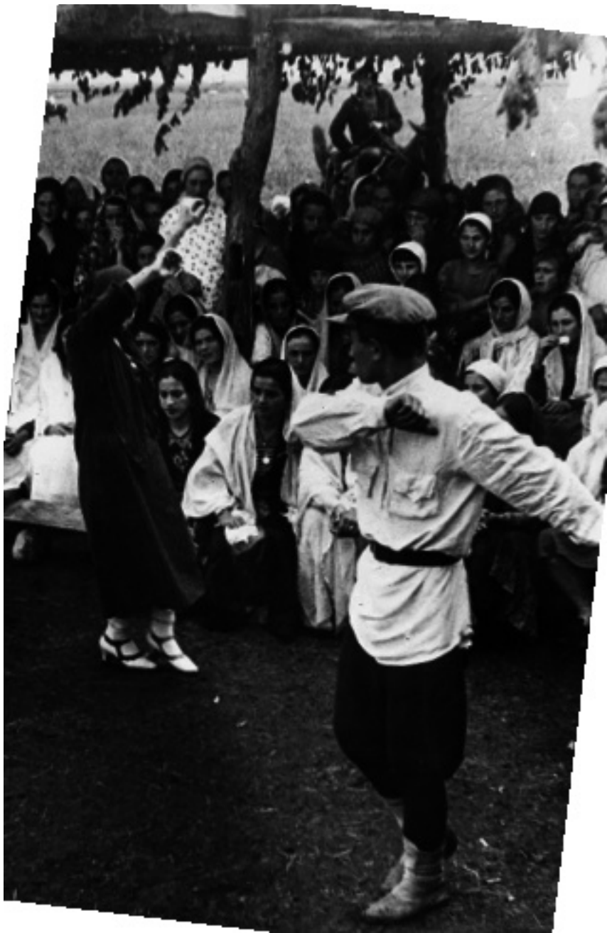
Чечня, жители с. Урус-Мартан. 1939 г.