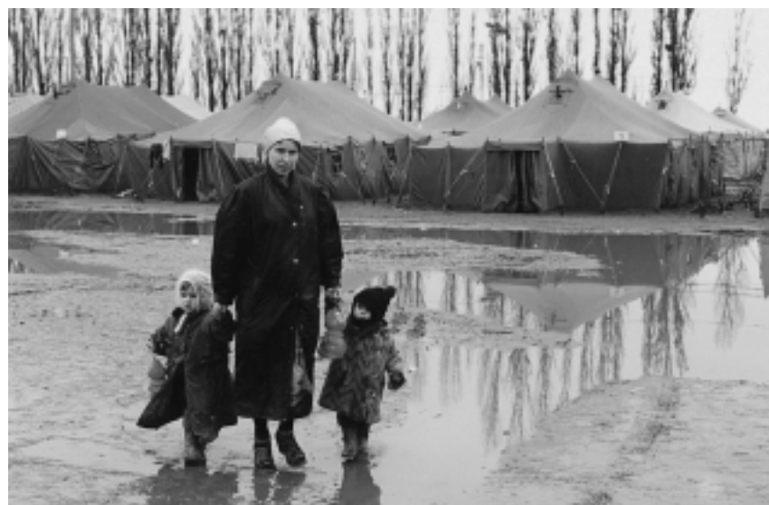
Палаточный городок беженцев в с. Знаменское