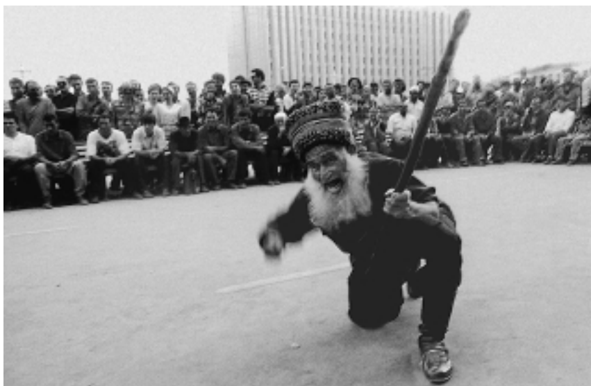
Зикр на площади Шейха Мансура